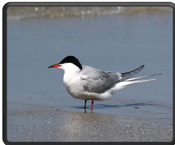
STERNE PIERRE GARIN

HABITE LES TERRAINS CALCAIRES CAILLOUTEUX ENSOLEILLÉS OCCUPÉS PAR DES PRAIRIES SÈCHES, DES CULTURES BASSES OU DES FRICHES.