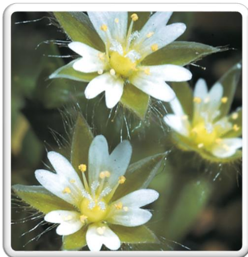
CÉRAISTE À PÉTALES COURTS

ON COMPTE SUR TOI POUR TROUVER UNE DE CES 3 PLANTES !